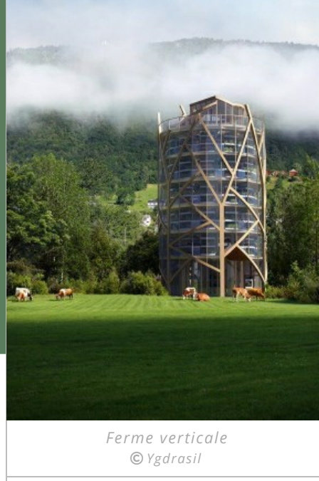
Ferme verticale