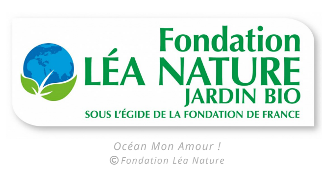
Océan Mon Amour !

Cet appel à projet est fermé, vous ne pouvez plus postuler.