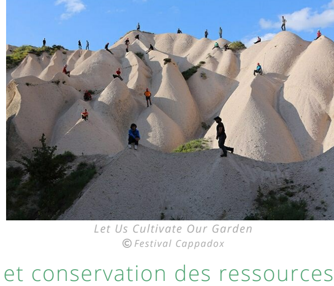
Let Us Cultivate Our Garden

En Cappadoce en Turquie, la problématique écologique a également sa place dans les appels à projet... Cool.