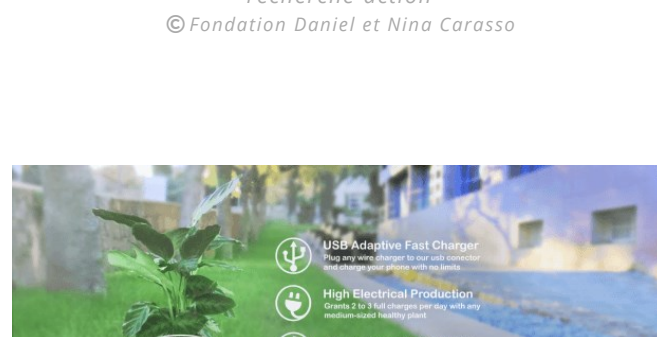
Bioo Lite (anglais)

Le concept est franchement sympa, sur tout s'il est suffisamment efficace et peaufiné. Peut être que ça mérite un coup de pouce ?