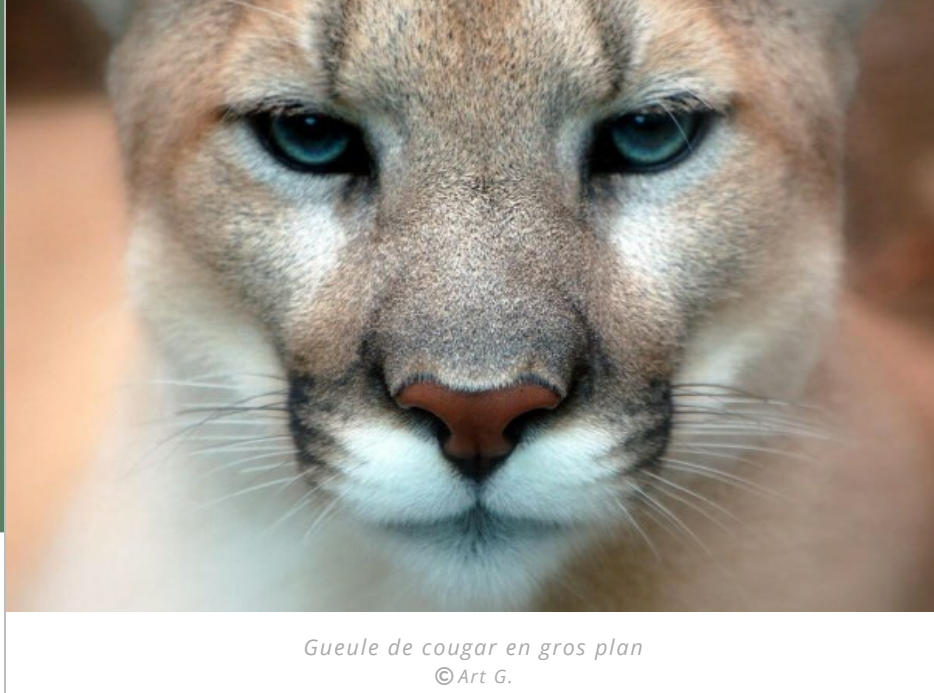
Gueule de cougar en gros plan