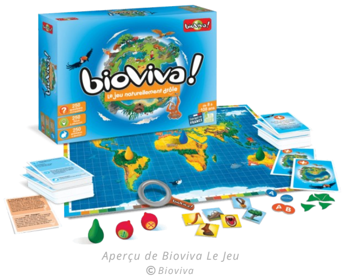
Aperçu de Bioviva Le Jeu

Il vient d'être revisité et comporte désormais encore plus d'humour, de questions-réponses insolites et de défis amusants.