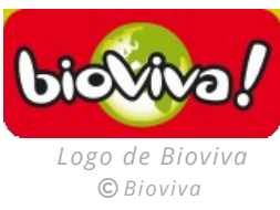
Logo de Bioviva © Bioviva

Bioviva conçoit, produit et commercialise, depuis 1996, des jeux de société.