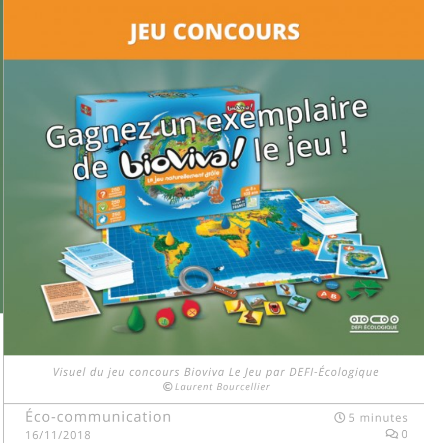
Visuel du jeu concours Bioviva Le Jeu par DEFI-Écologique