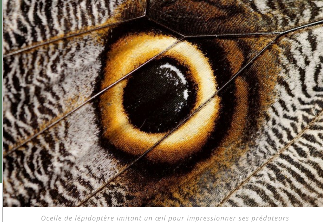
Ocelle de lépidoptère imitant un œil pour impressionner ses prédateurs