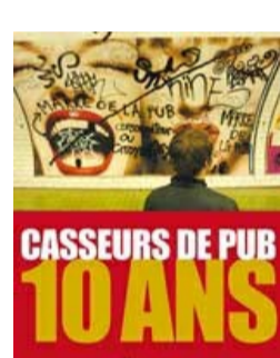
Affiche des casseurs de pub fêtant leurs 10 ans © Casseurs de pub

L'association « Casseurs de pub » y réfléchit intensivement depuis 1999, avec des actions aussi originales qu'efficaces. Cette association relaye par exemple des manifestations comme « Journée sans achat », « Rentrée sans marque » ou encore la « Semaine sans télé ». Elle organise des colloques, des spectacles, réalise des films d'animations, des expositions, etc. À savoir, pour faire bonne mesure, que l'association « Casseurs de pub » a été fondée par un ancien publicitaire.